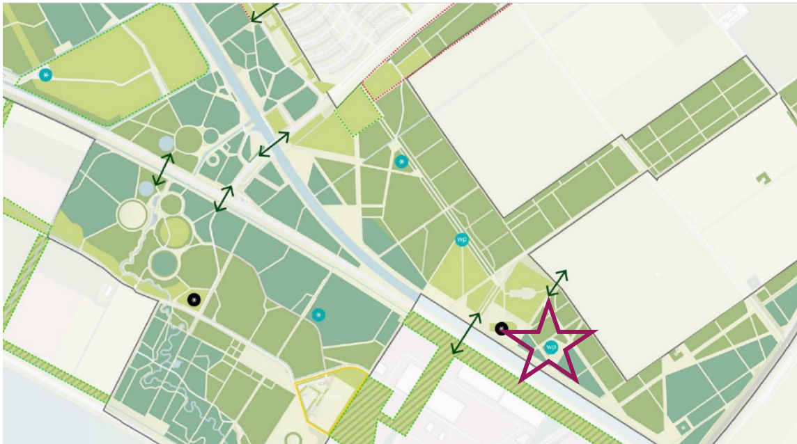
Voorstel Ons-bosicoon, aangrenzend aan Oosterwold. Kaart: Nohnik

We stellen voor dit jaar te starten met de verkenning om een Ons-bosicoon in te richten nabij Oosterwold (zie kaart). De Avontuur- en Stijlzoekers in Oosterwold lenen zich uitstekend om een voortrekkersrol te nemen. Vanuit het gedachtegoed van Oosterwold zijn zij zelfredzaam en hebben zij ervaring met het zelf opzetten en ontwikkelen van nieuwe initiatieven. Je betreft hen door middel van creatieve werkvormen en zo min mogelijk kaders op te leggen. Het Ons-bosicoon wordt ontwikkeld met Oosterwolders, maar groeit door naar een stadsbreed en vervolgens regiobreed participatiecentrum voor het Almeerderhout.